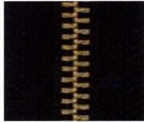
Metal / Metal / Métal