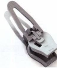
Straight puller / Cierre Recto / Tireur tout droit