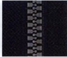
Plastic / Plastico / Plastique