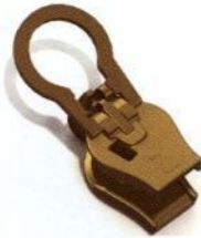
Round puller / Cierre Redondo / Tireur rond